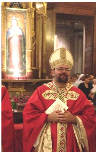
Mons. Paolo Giulietti , ordinato Vescovo Ausiliare di

Nello stesso tempo non aver paura della diversità che notiamo all'interno delle nostre comunità. La diversità se accolta può diventare la nostra ricchezza e la bellezza di una comunità: essa infatti è dono dello Spirito che suscita varietà di carismi e di modalità di incarnare la salvezza nella storia.